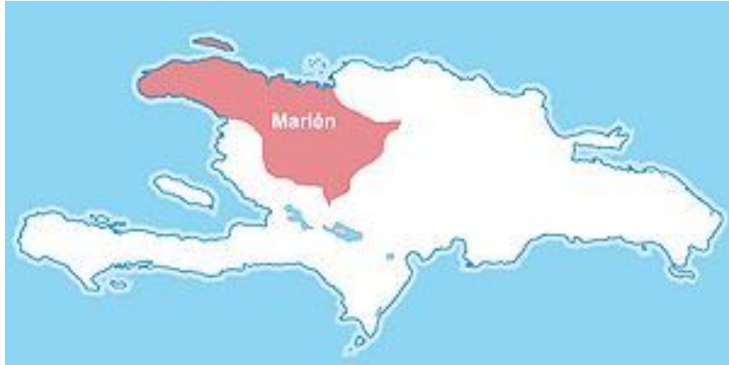
Guacanagarí, cacique del Marién