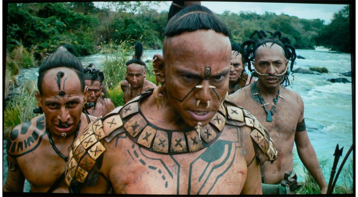
Imagen tomada de la película Apocalypto de Mel Gilbon