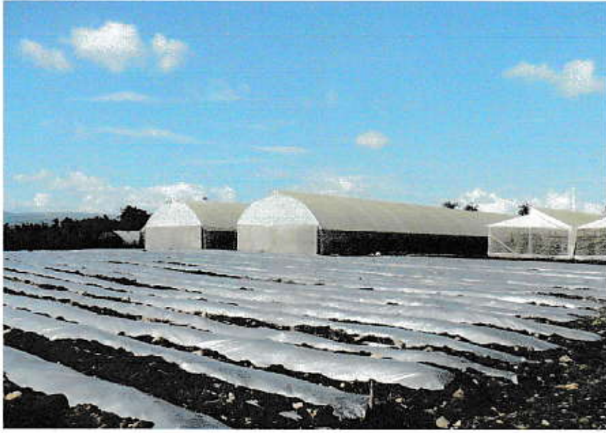
Cultivos en ambiente controlado y plasticultura para capacitación en el Centro Tecnológico Universitario