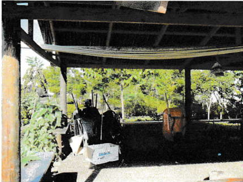
Vivero de plantas forestales y ornamentales que integra mujeres víctimas de violencia y que se utiliza para el embellecimiento del entorno del Centro tecnológico y el parque Industrial